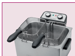
2 små korgar för tillagning av olika matvaror samtidigt