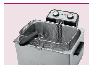
1 stor korg

Color: Stainless steel Article-No.: 501 038 Article EAN-Code: 4 006 160 011 203 Exportpack EAN-Code: 4 006 160 036 237 PU: 2 pcs. Pallet: 20"/40"/HQ Container: 630 / 1290 / 1500